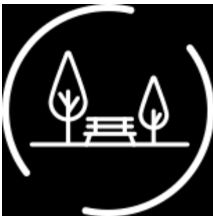
コミュニティ センター