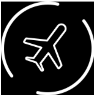
旅行の セキュリティ