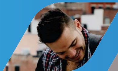
極端な角度での認識